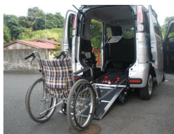
スロープがコンパクトで広げやすい。