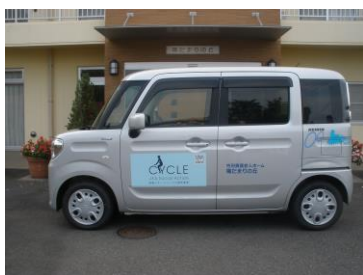
銀の車体に青い標識と施設名が映えます。

https://www.hidamarino-oka.com/global-data/20221113110100379.pdf